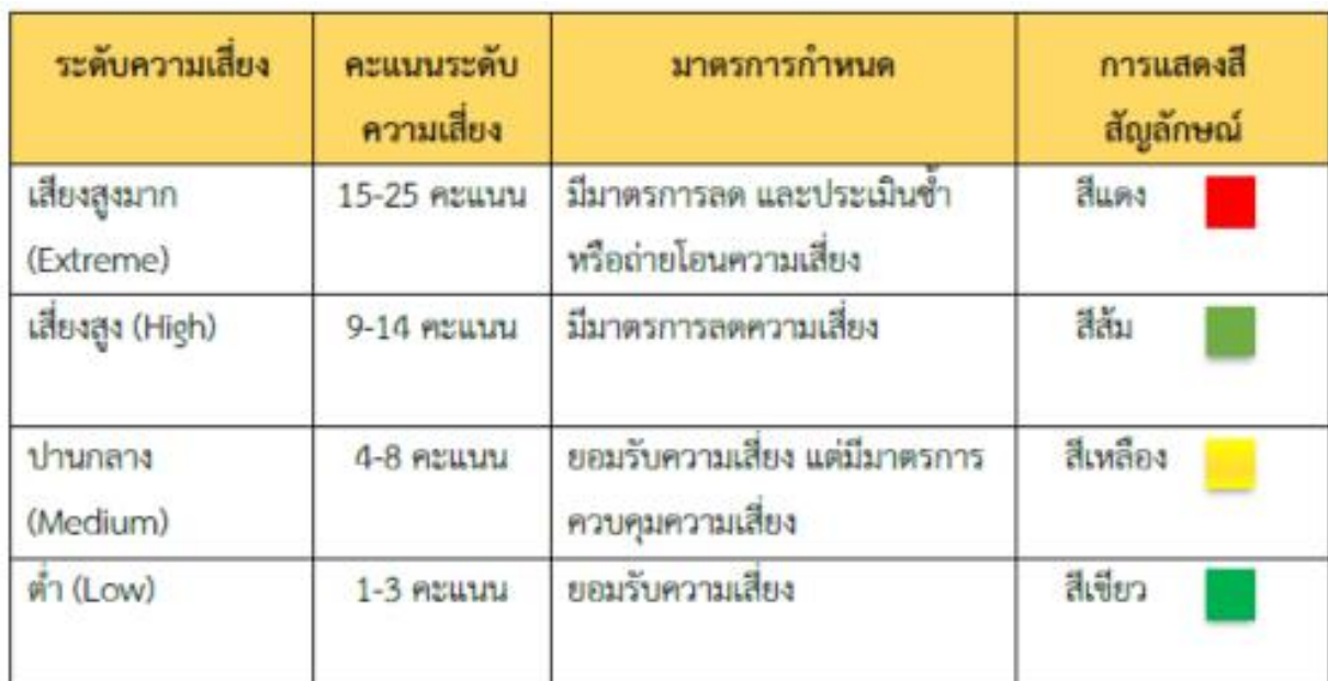
ตารางระดับของความเสียหาย (Degree of Risk)

ซึ่งจัดแบ่งเป็น ๔ ระดับ สามารถแสดงเป็น Risk Profile แบ่งพื้นที่เป็น ๔ ส่วน (๔ Quadrant) ใช้เกณฑ์ในการ จัดแบ่ง ดังนี้